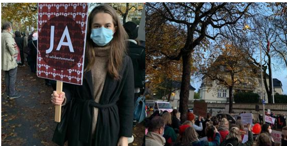
Bildetekst: Sex og Politikk deltok i demonstrasjon utenfor den polske ambassaden i Oslo oktober 2020.

I et brev sendt til utenriksminister Ine Marie Eriksen Sørreide, helse- og omsorgsminister Bent Høie og kultur- og likestillingsminister Abid Raja uttrykte Sex og Politikk sin bekymring for situasjonen i Polen og ba den norske regjeringen fordømme den overdrevne voldsbruken mot demonstranter, aktivister og kvinneverrettsorganisasjoner. I sitt svarbrev skriver ministrene at de deler oppfatningen om at kvinners rett til å bestemme over eget liv og egen kropp er en grunnleggende menneskerettighet og at dette fortsatt vil være en viktig prioritering både i regjeringens nasjonale likestillingspolitikk og i utenrikspolitikken.