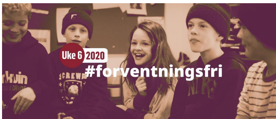
Bildetekst: Kampanjebilde Uke 6, #forventningsfri

Vi utarbeidet en egen kampanjeside med tre alderstilpassede kampanjepakker til henholdsvis 1.-4. trinn (med undertema Følelser ), 5.-7. trinn (med undertema Kropp og kroppsidealer ) og 8.-10. trinn (med undertema Forskjellen mellom porno og sex ). Kampanjepakkene inneholdt utvalgte oppgaver, PowerPoint-presentasjoner, quiz (Kahoot), plakater, informasjonsskriv til foreldre og foresatte og filmer. Under emneknaggen #forventningsfri publiserte vi daglig innhold på sosiale medier, blant annet tre korte videoer tilpasset ungt publikum og bruk i undervisning: Hva er å være normal , Trenger vi rom for samtaler og Hvordan snakke om kondombruk . Videoene ble godt mottatt og delt på sosiale medier.